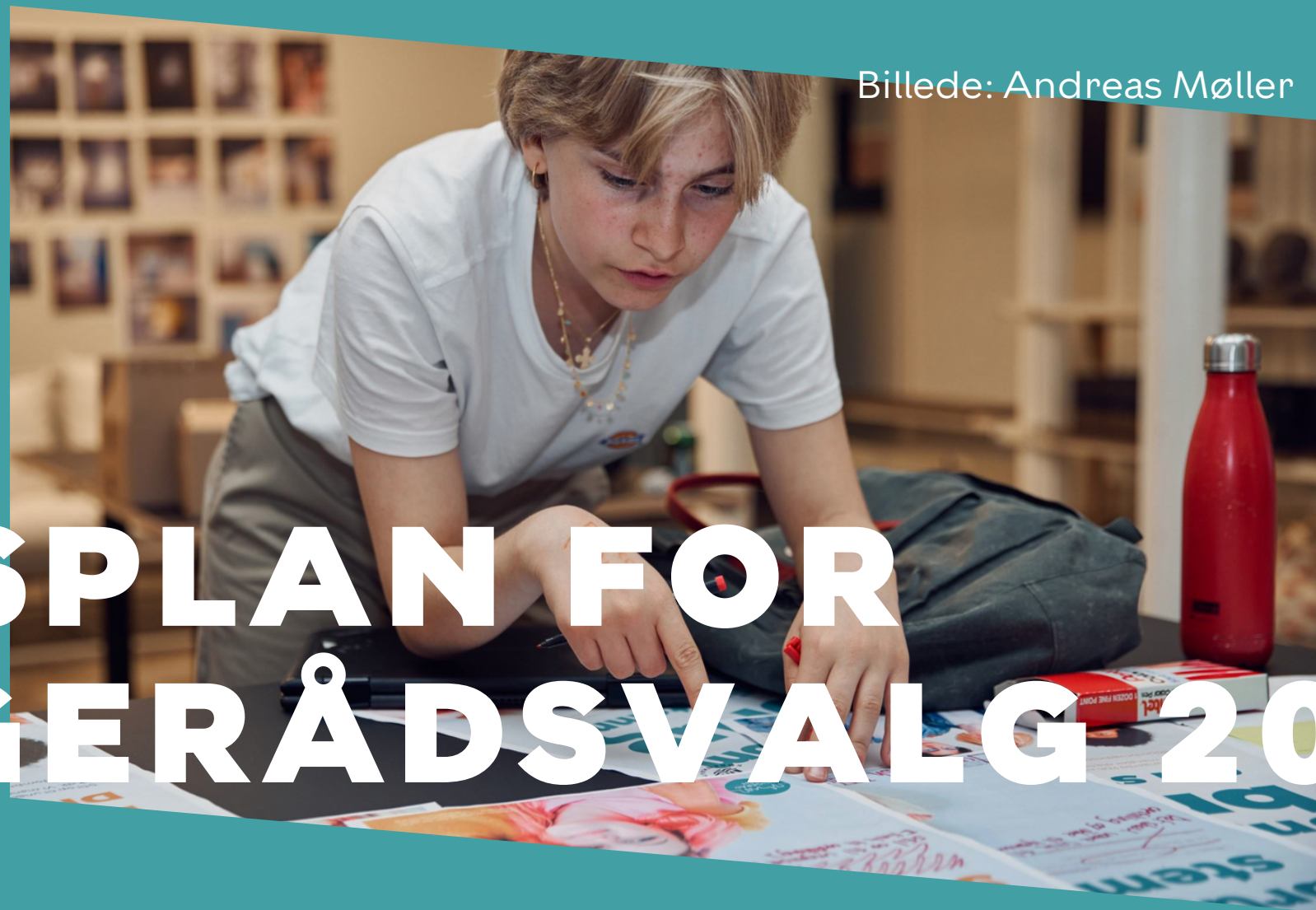
Billede: Andreas Møller